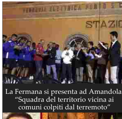
La Fermana si presenta ad Amandola: "Squadra del territorio vicina ai comuni colpiti dal terremoto"

Per seguire il tour, avere informazioni sul progetto, i luoghi degli incontri e le modalità di adesione alla campagna, si possono consultare i siti www.becrowdy.com , www.scrittorefelice.it e www.mus-e.it .